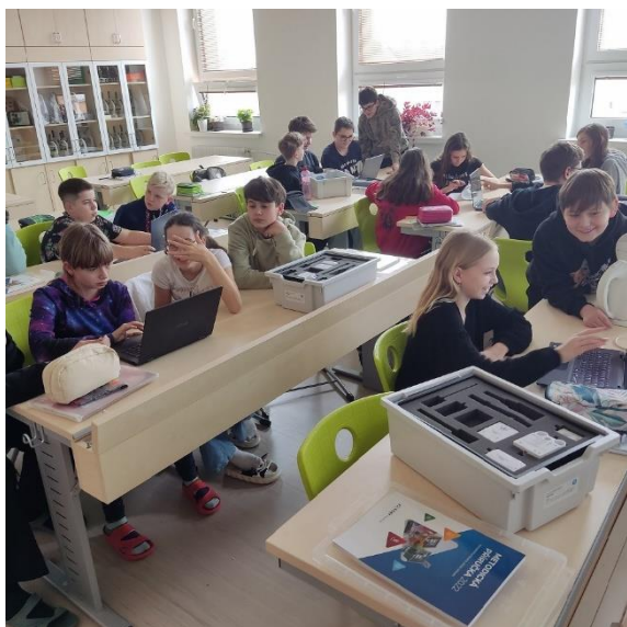
Badatelská výuka fyziky Pasco