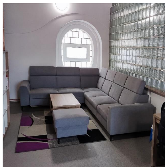
Zázemí pro asistentky pedagoga