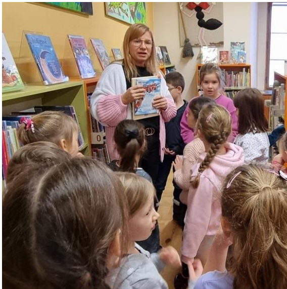
Návštěva okresní knihovny Chomutov