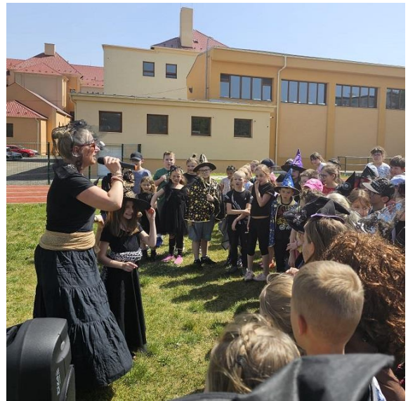
Pálení čarodějnic (ŠD)