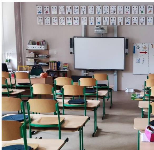
Zrekonstruovaná učebna č. 5