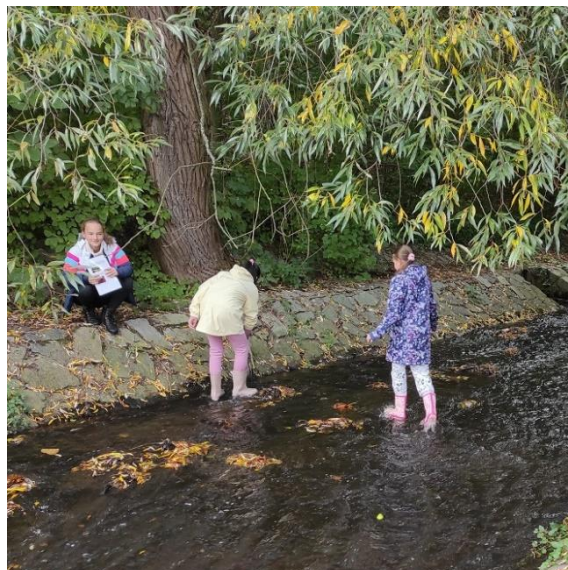
Recyklohraní - voda