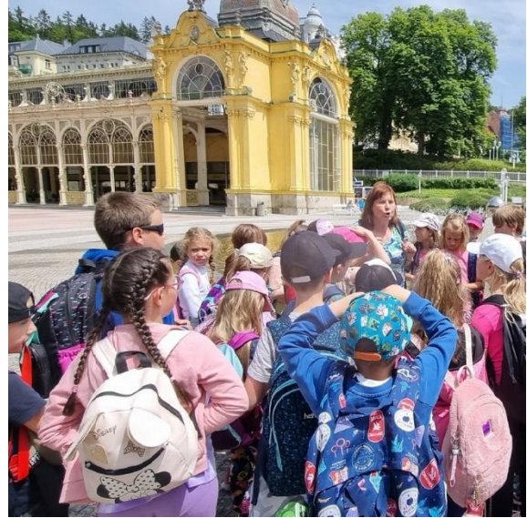
Výlet Mariánské Lázně