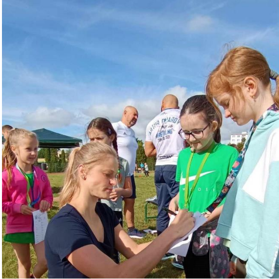
Den zdraví a sportu