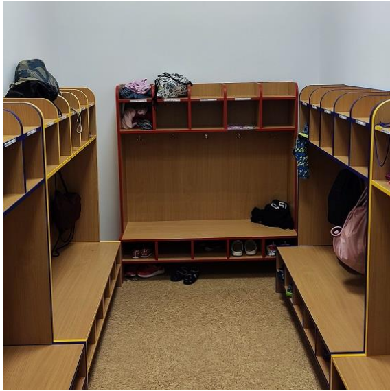
Nová šatna ŠD