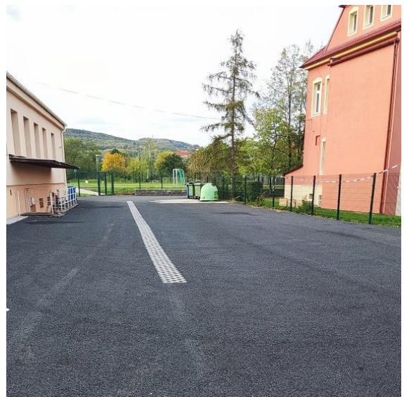
Opravená plocha dvora