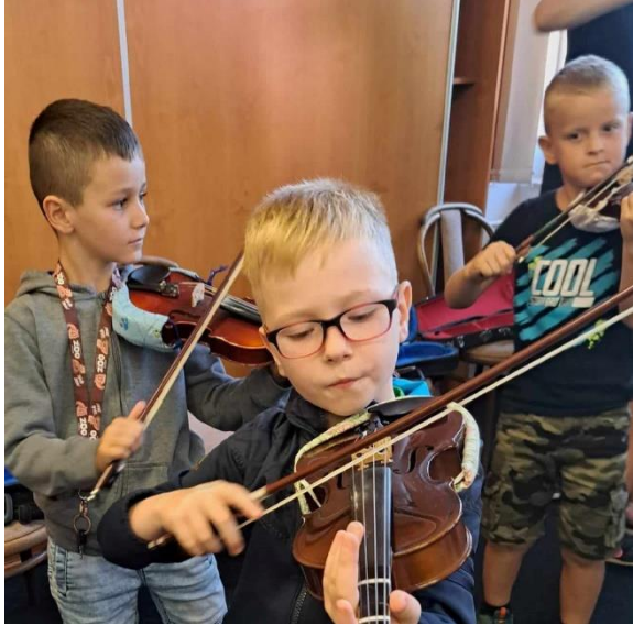
Návštěva ZUŠ Chomutov