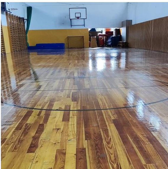
Opravená podlaha velké tělocvičny