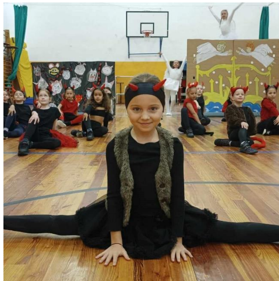
Vánoční představení (Jarmark)