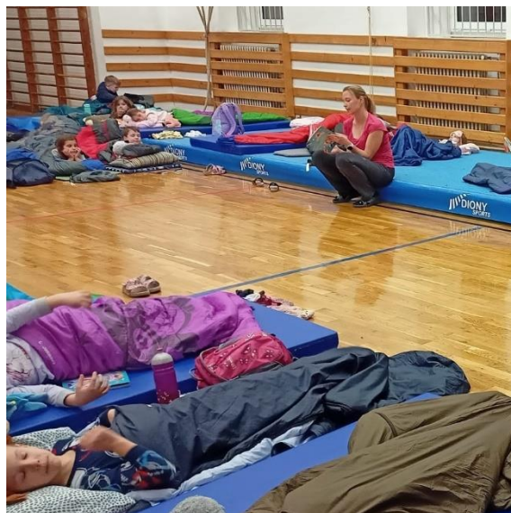
Noc s Andersenem