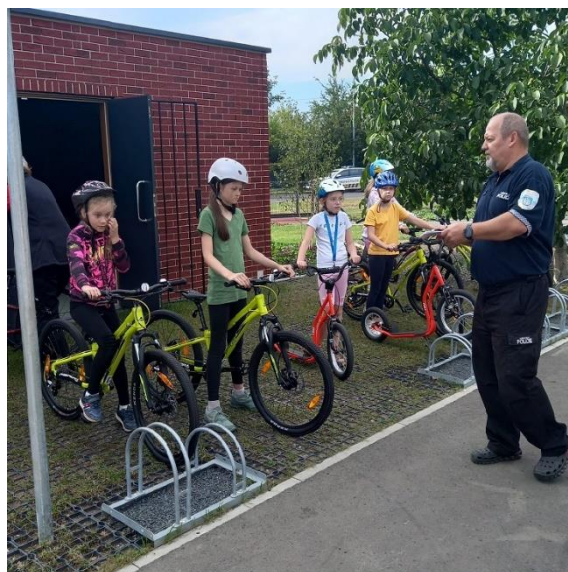
Návštěva dopravního hřiště