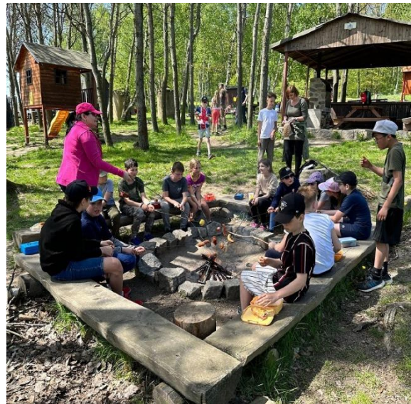
Branný den na Kočičáku