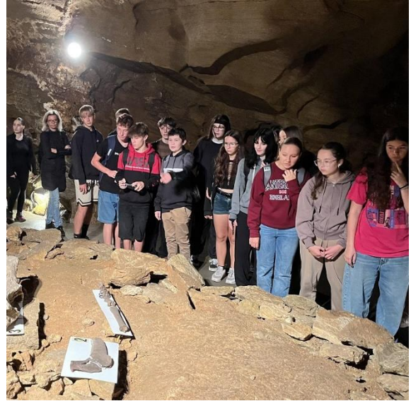
Výlet Koněpruské jeskyně