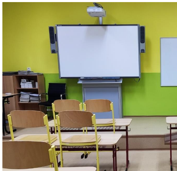
Zrekonstruovaná učebna č. 22