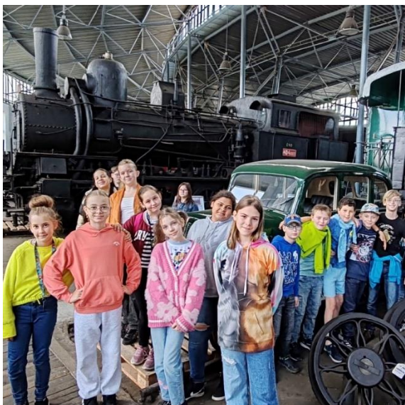
Návštěva železničního muzea