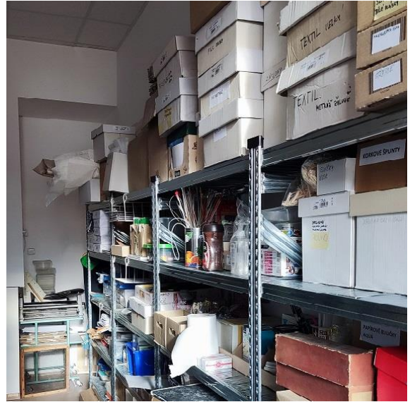
Zrekonstruovaný kabinet Vv