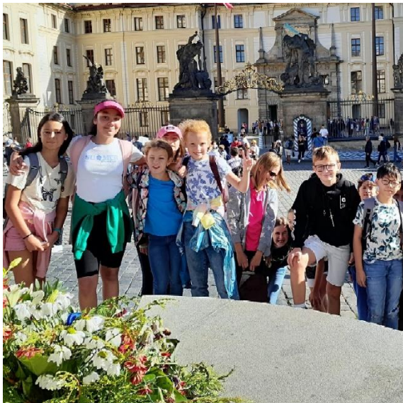
Exkurze Pražský hrad